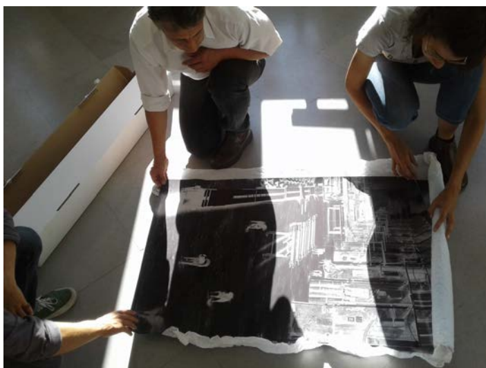
Gilles Saussier et des étudiants ; séminaire en cours

Depuis la fin des années 1990, Gilles Saussier déploie une activité ouverte, construite autour d'un nombre choisi de projets et de corpus d'images, qu'il revisite, entrecroise et recompose sans cesse pour en enrichir la lecture et l'actualité. C'est à partir du recueil d'images intitulé Spolia , initié en 2011, que le photographe investit les salles d'exposition de l'Esban. Ce projet explore le territoire roumain de l'œuvre de Brancusi et de l'ensemble monumental de Târgu-Jiu, la seule de ses œuvres construite dans l'espace public et comprenant une Colonne sans fin de près de 30 mètres de haut. L'enquête porte un regard nouveau sur ce que l'on croit connaître de l'œuvre du sculpteur.