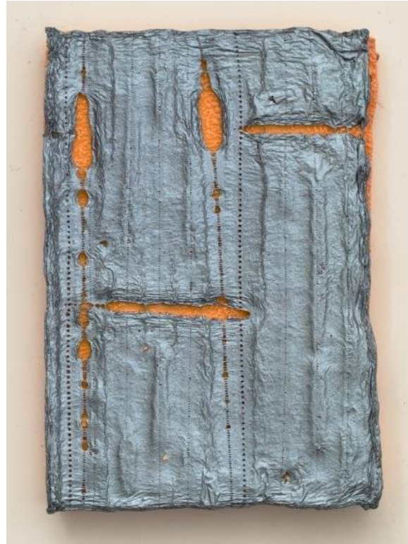
Altération , 2014, peinture, cire, polystyrène, 5x27x20 cm