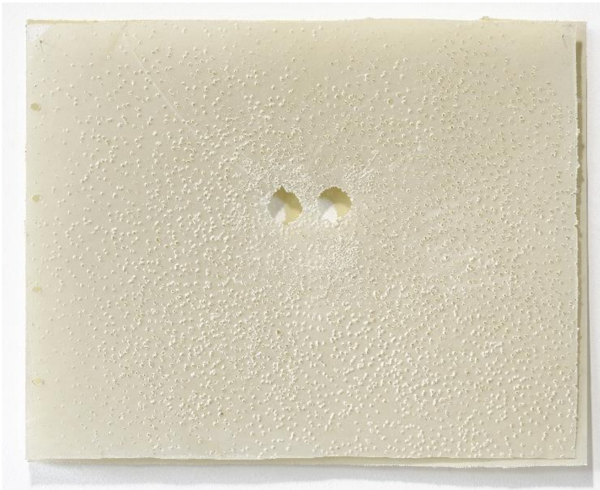
Face, 2008, 40 x 60 cm, cire sur papier

Dominique De Beir est co-fondatrice de Friville Editions depuis 2011.